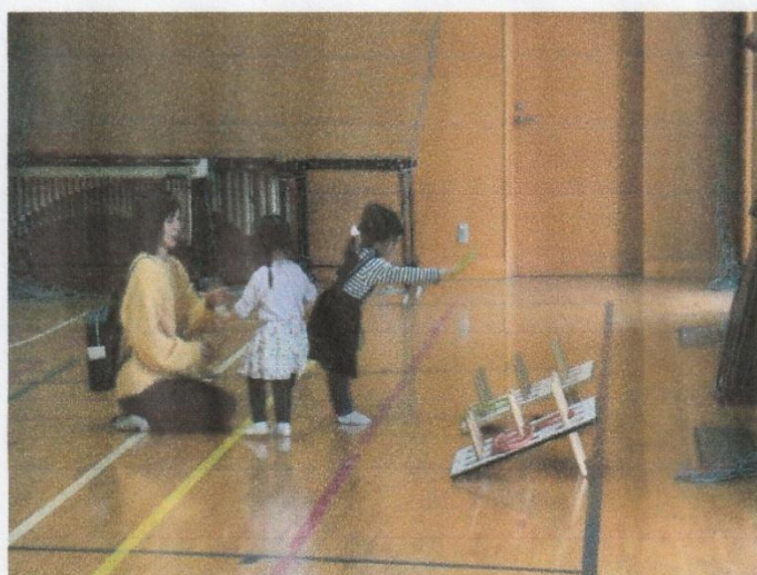
11月 わくわく子ども広場（高野口小体育館）