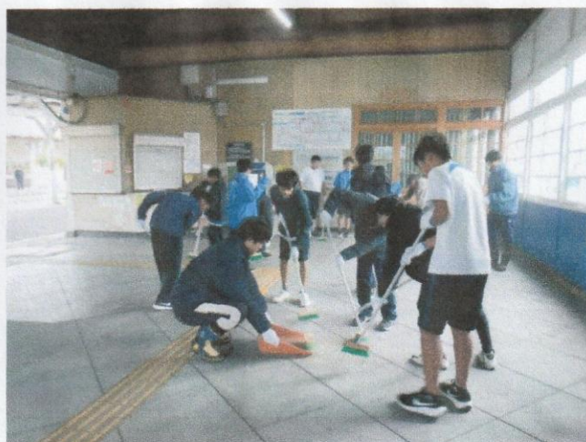
1 2 月 J R 高野口駅の美化活動