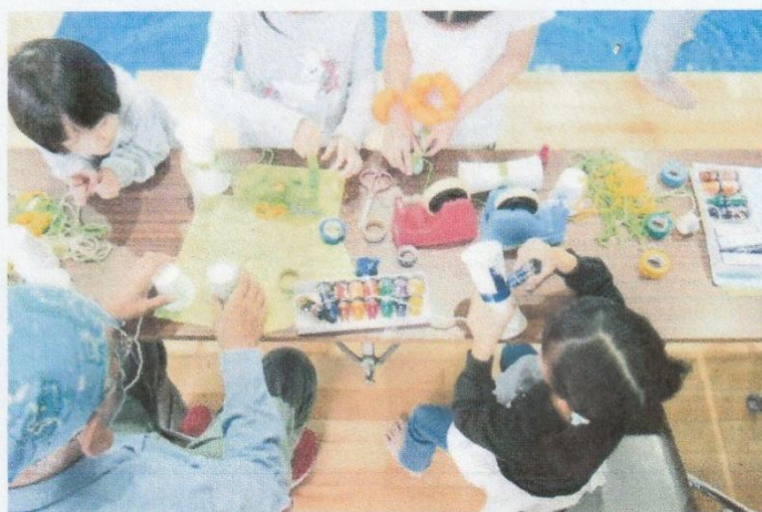
11月 わくわくこども広場（高野口小体育館）