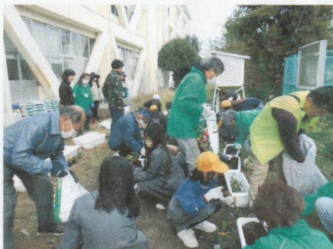
1 1 月 花植え交流会 (応其小学校)