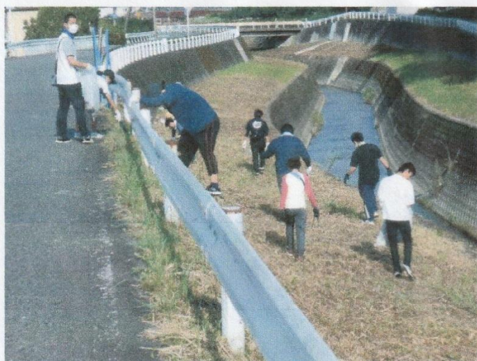
7月 田原川とその周辺の美化活動