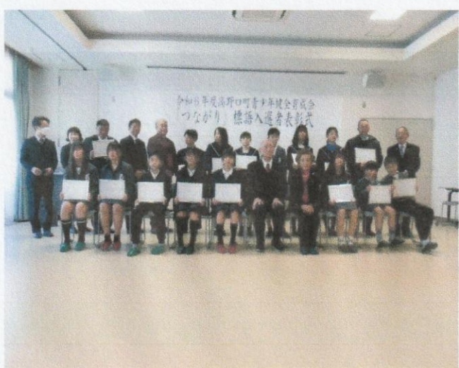
1 月 「つながり」 標語表彰式 (公民館)