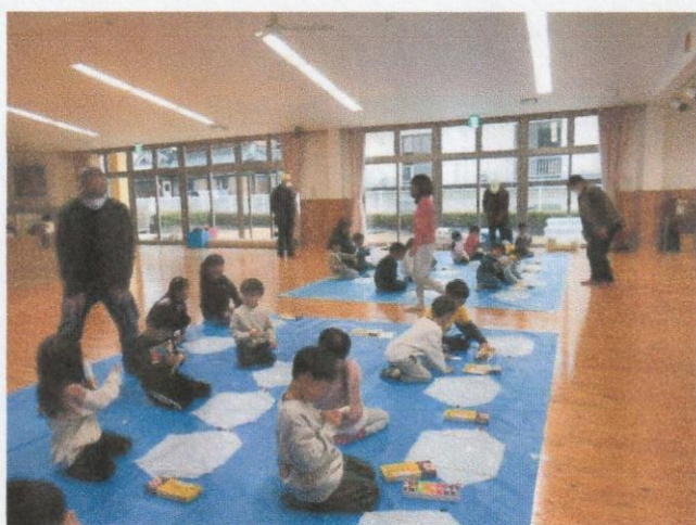
1 月 たこ作りたこ揚げ会 (高野口こども園)