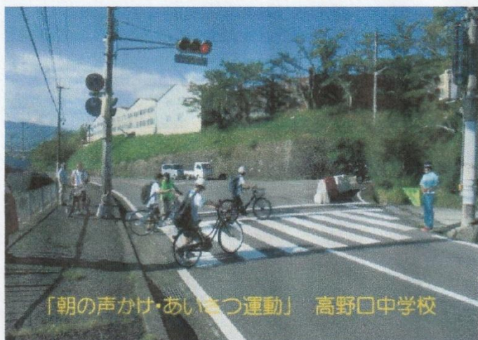
9月 朝の声かけ挨拶運動（高野口中学校）